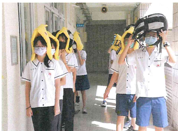
地點：各班教室 時間：111/9/21 說明：防災演練-地震結束後，學校成立災害應變小組廣，廣播請同學集結在走廊準備進行疏散。