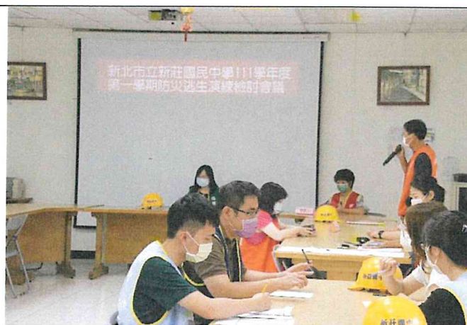
地點：學務處 時間：111/9/21 說明：影片播放完畢，主任就防災要點做重點提醒，提升學生及老師對防災的認知與技能。