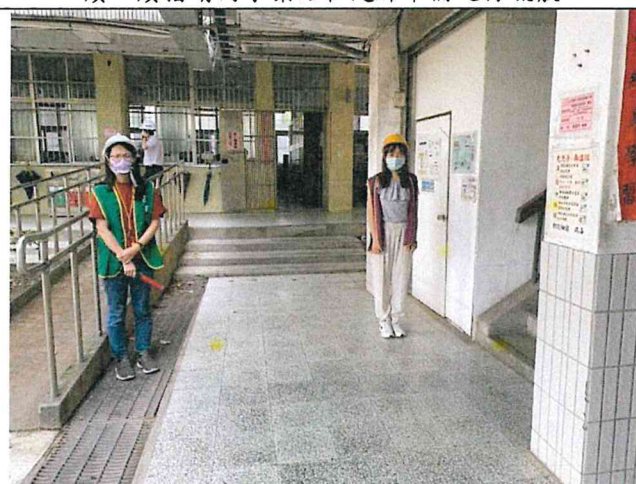
地點：樓梯口 時間：111/9/21 說明：避難引導組就疏散引導位置，準備引導疏散學生。