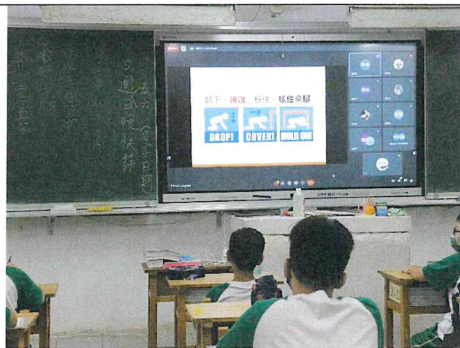
地點：各班教室 時間：111/9/2 說明：防災宣導