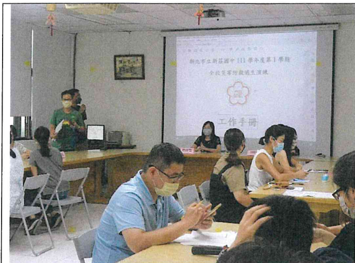
地點：中正二樓會議室 時間：111/8/29 說明：防災工作小組會議

*活動照片與說明（因校園戶外空間施工，故本次防災演練只進行到走廊集結，準備疏散）：