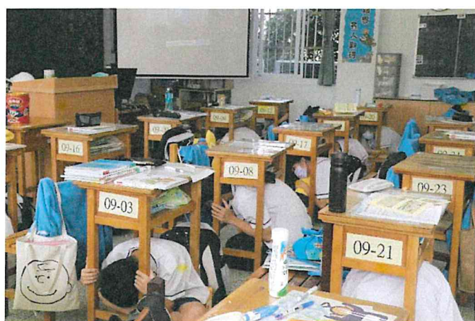
地點：各班教室 時間：111/9/21 說明：防災演練-地震發生時，趴下、掩護、穩住。