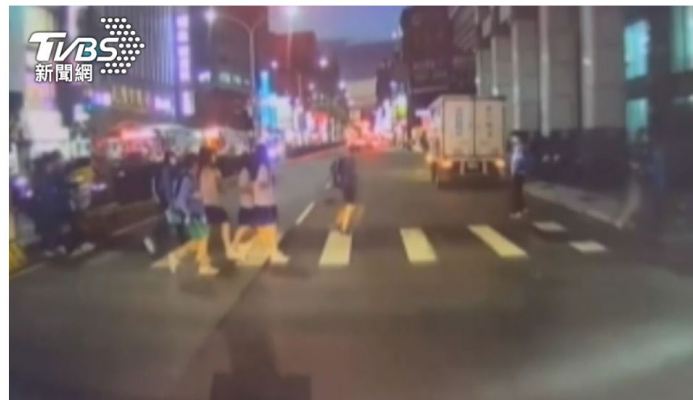
救護車送病患就醫途中經行人穿越道，行人卻未禮讓救護車先行。

參考資料： https://news.tvbs.com.tw/local/2299182 https://nie.mdnkids.com/teaching2.html?s=215F00000TR LWRM